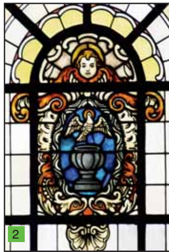
Sakrament der Taufe

Vom Hauptaltar aus blicken wir in das Kirchenschiff. Das Licht rechts und links fällt durch die acht Sakramentsfenster aus den 1920er/1930er Jahren. Vorne rechts steht Christus, der König, von dem die Sakramente ausgehen. Das Christkönigsfest wurde in dieser Zeit in den liturgischen Kalender eingefügt. Das Fenster in der Diagonale – hinten links – symbolisiert mit den gekreuzten Schlüsseln und den Herrschersymbolen die dienend-(ver-)bindende Funktion der Priester bei der Spendung der Sakramente, hier das Bußsakrament: „Was