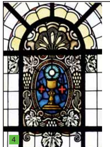
Sakrament der Eucharistie

3. Eucharistie als volle Gemeinschaft mit Christus. Wiederum beherrscht Blau als Farbe der Treue das Bild, im Vordergrund. Kelch und Hostie. Ähren und Weinblätter rahmen das Bild: die Frucht der Erde, des Weinstocks und der menschlichen Arbeit. Durch das