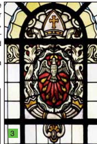
Sakrament der Firmung

1. Taufe: - Die Farbe Blau ist die Farbe des Wassers, aber auch der Treue gegenüber der erkannten Wahrheit. Über dem Taufbecken die Taube des hl. Geistes; darüber das Kindergesicht eines Täuflings – oder seines Schutzengels?. Unten am Bildrand die Muschel, mit der (das Tauf-) Wasser geschöpft wird.