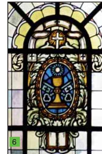
Sakrament der Weihe

5. Das Sakrament der Weihe wird durch priesterliche Insignien symbolisiert: im Zentrum der Kelch, die gekreuzten Schlüssel (für die