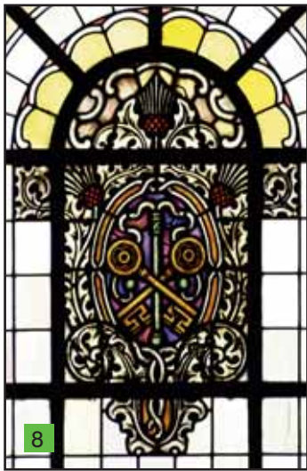
Sakrament der Buße

verdeutlichen oben die Sanduhr, unten der Totenkopf; weiterhin die gefalteten Hände, von Kerzen gerahmt, das aufgeschlagene Buch (des Lebens), in dem Christus als Alpha und Omega – Anfang und Ende – dem Menschen entgegentritt; darunter das Gefäß mit der „Wegzehrung“.