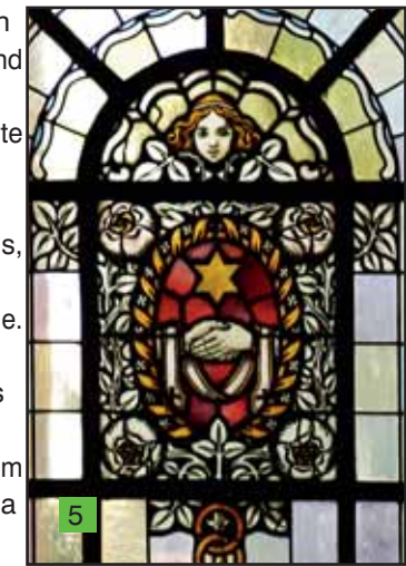
Sakrament der Ehe

6. Auch bei der Darstellung der Krankensalbung findet sich wie in der vorhergehenden Blau als Grundfarbe (s.o). Die früher verbreitete Vorstellung der „letzten Ölung“